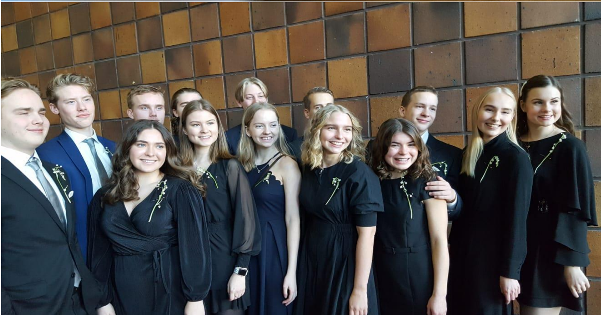
Kieltojuhlaan on pukeuduttu tummaan asuun vuodesta 1913 lähtien. Juhla on ainutlaatuinen perinne suomalaisessa lukiokoulutuksessa.