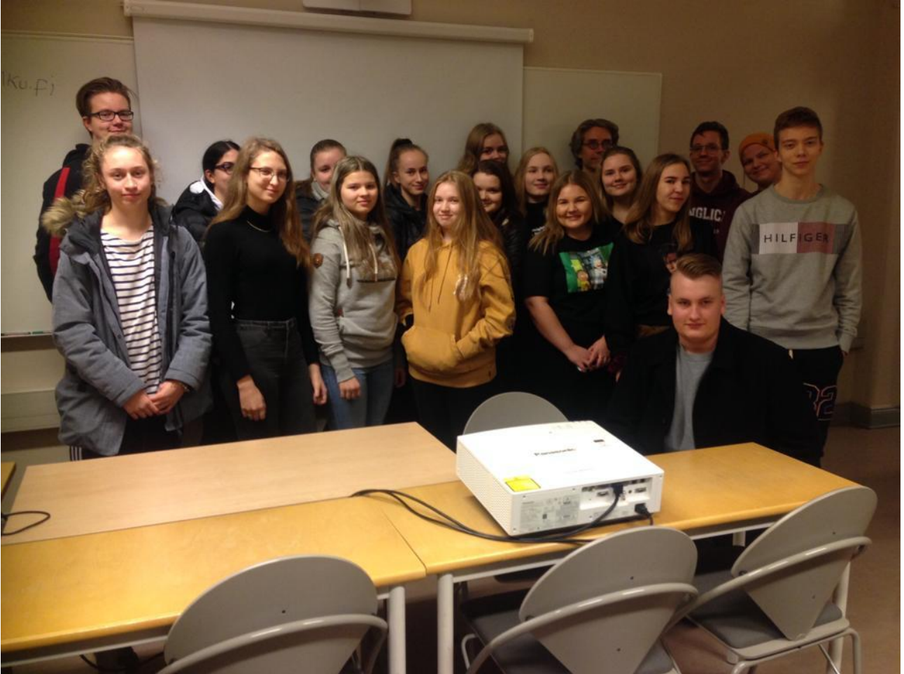
The English Club tutustumassa Turun yliopiston englannin laitokseen.

The English Club toimi aktiivisesti koko lukuvuoden, jolloin klubilaiset perehtyivät anglosaksiseen kulttuuriin ja syvemmin vielä irlantilaiseen elämänmenoon. Suullisten esitelmien myötä pääsimme perehtymään tuon ihanan smaragdisaaren saloihin. Harmiksemme toukokuuksi suunniteltu kulttuurimatkamme Dubliniin peruuntui koronaviruksen suljettua koulun ja etäopetuksen alettua.