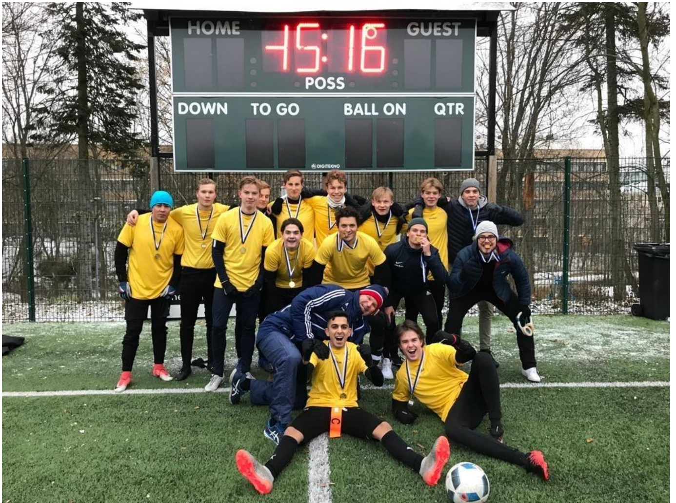
Jalkapallon Suomen Mestaruus Luostikseen. OIKEIN HYVÄÄ JA ILOISTA KESÄÄ TEILLE KAIKILLE!