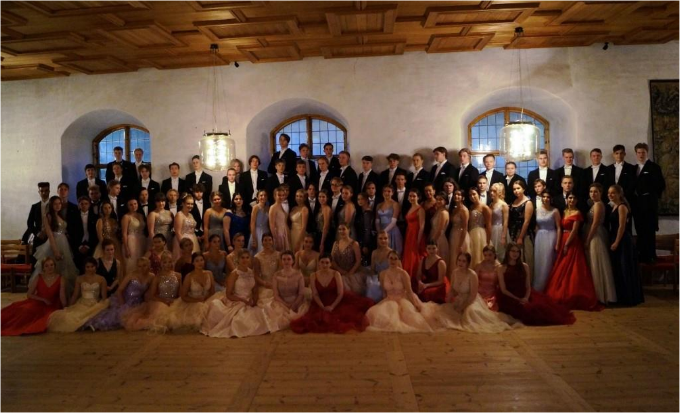
Turun linnan Kuninkaan- ja Kuningattaren salissa